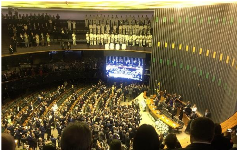
大統領就任式出席(1月1日)／ Cerimônia de posse do Presidente (1º de Janeiro)