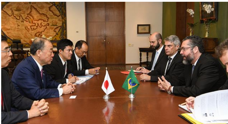
アラウージョ外務大臣表敬／ Visita de Cortesia ao Ministro de Estado das Relações Exteriores, Embaixador Ernesto Araújo