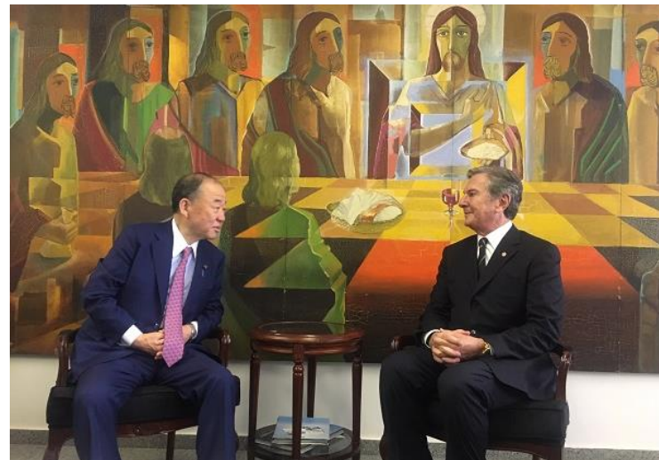
コロール元大統領表敬／ Visita de Cortesia ao ex-Presidente Fernando Collor de Mello