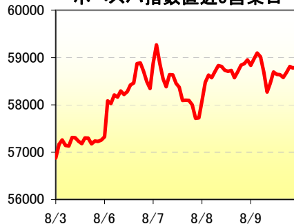
ボベスパ指数直近5営業日