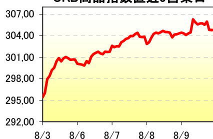
CRB商品指数直近5営業日

当資料は相場情報の提供を唯一の目的としたもので、投資勧誘を目的としたものではありません。投資の最終決定は投資家ご自身の判断でなさるようお願い致します。当資料は信頼できる情報源から得た情報に基づき作成したものです。その情報の正確性、安全性を保障するものではありません。また、過去の結果が必ずしも将来の結果を暗示するものではありません。当資料は執筆者の見解に基づき作成されたものであり、弊社の統一された見解ではありません。当資料を使用することにより生ずるいかなる種類の損失についても弊社は責任を負いません。